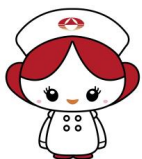
メタローナちゃん

D判定の方は、医療機関で検診・検査を受けることをお勧めします。 C判定の方は、要経過観察です。該当部位を気にかけてお過ごしください。